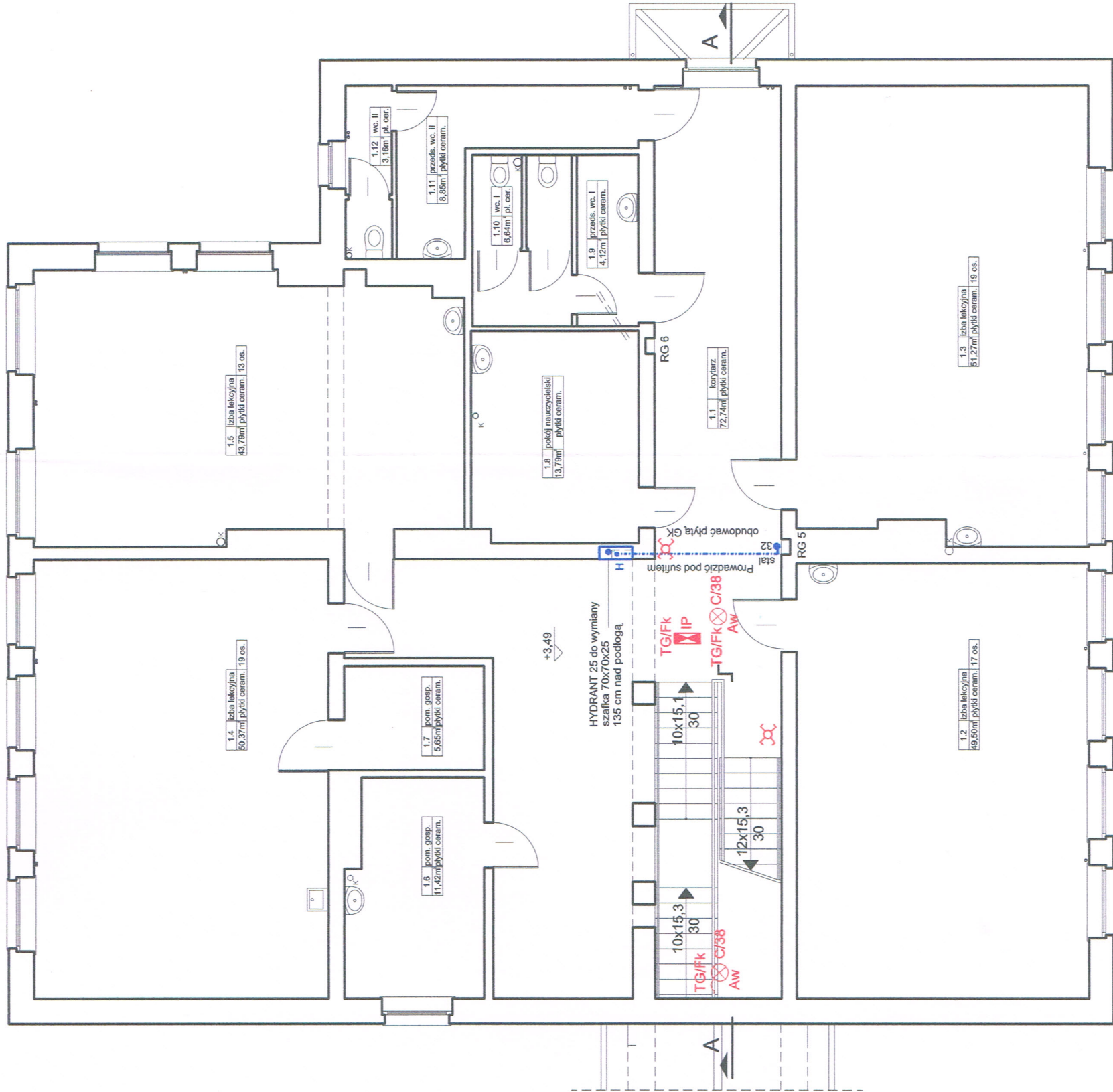
RZUT I PIĘTRA